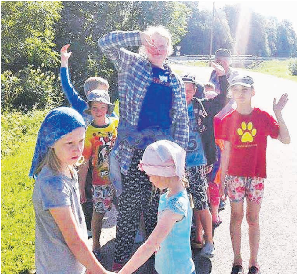
Laagri esimesel päeval matkati Kuluse hiiumummuga mäele.