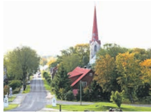
Vaade Lihula kirikule.

Ent iga aasta toob ka midagi uut. Nii täitus kirikuaed ühel