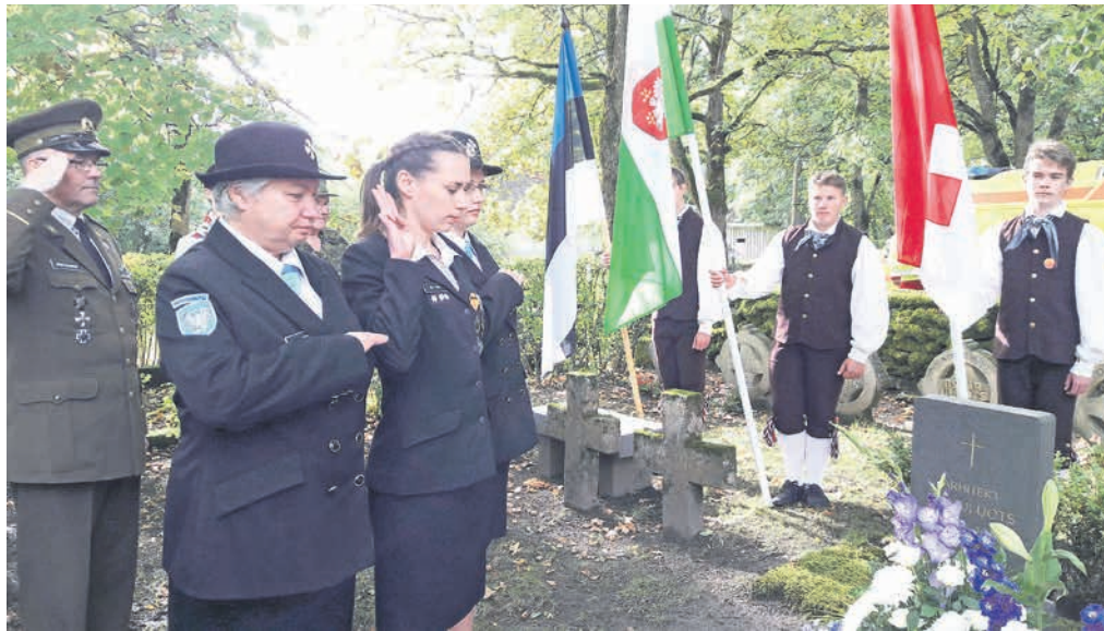
Kaitseliitlased, naiskodukaitsjad ja kodutütred asetavad pärja Jüri Uluotsa hauale ja annavad Kirblast pärit suurmehele au.

22. september. Vastupanuvõitluse päev Kirblas.