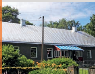
Pastoraat sai toetajate abiga osaliselt uue plekk-katuse