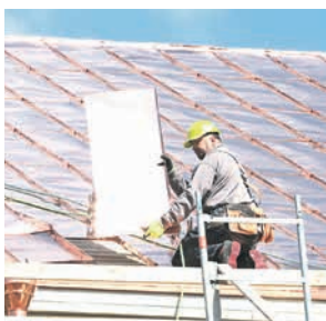
Toomkiriku viimase plekktahtvli panemine.