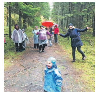
Vihmane, aga lõbus perepäev Nis- si vallas Valgejärve matkarajal.