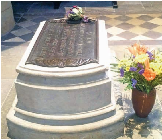
Martin Lutheri haud Wittenbergi lossikirikus.