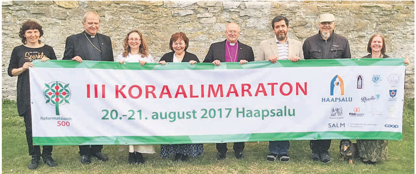
Viimased pildid koos koraalimaratoniga ja maraton on õnnelikult lõpule jõudnud.

Kantselei avatud E, K, R kl 9–15. Jumalateenistus pühapäeviti kell 11 toomkirikus (vastavalt teadetele Jaani kirikus), reedeti kl 9 hommikupalvus Jaani kirikus