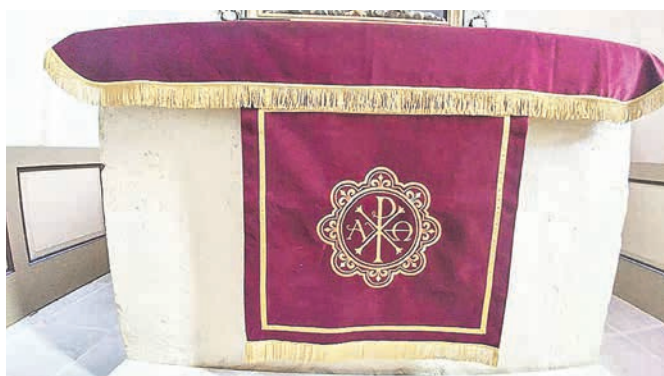
Tänavu kevadest on Hanila kirikus uus altarikatte, altari- ja kantslipõll.

Altari pilt ja altarivõre on altarilaua suhtes sekundaarsed elemendid, nende ülesanne on rõhutada altari pühadust ja tähendust. Altarivõrel ja selle põlvituspingil on ka praktiline otstarve, võimaldades kogudusel altarisakramenti ja õnnistamist põlvitades vastu võtta.