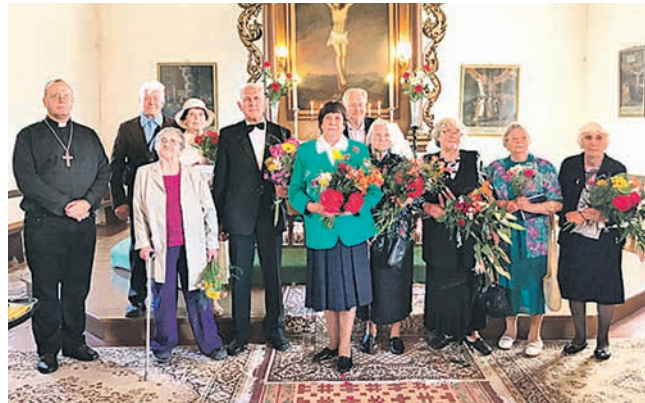
Leerimälestuspäev Varbla kirikus.