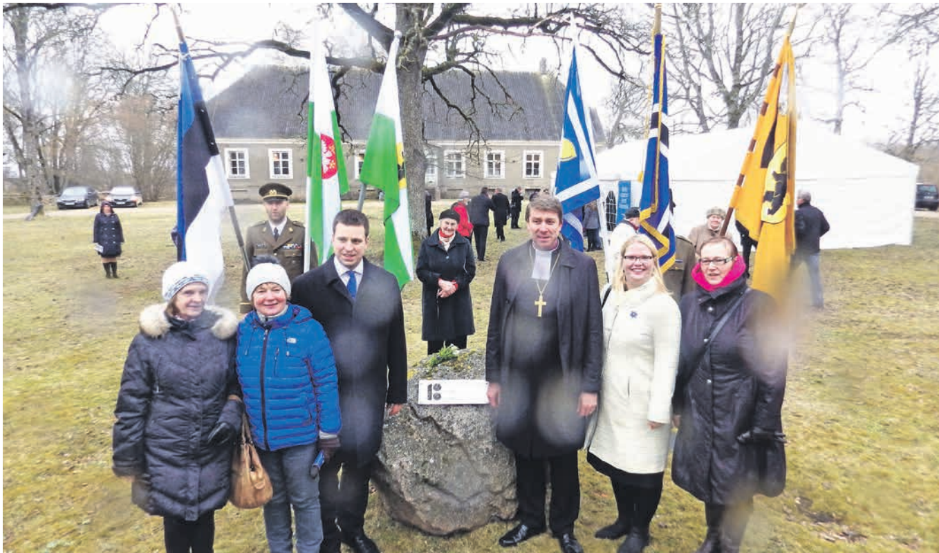
Eesti 100. sünnipäeva puhul avati Mihkli pastoraadi ees mälestuskivi, peaminister Jüri Ratas istutas ühele poole kivi tamme, teisele poole istutas peapiiskop Urmas Viilma õunapuu.

88421 Mihkli, Lääneranna vald, Pärnumaa, 5691 5347 (hooldajaõpetaja), mihkli@eelk.ee, www.eelk.ee/mihkli Koguduse hooldajaõpetaja Kaido Saak, diakon Meelis Malk, juhatuse esimees Targo Pikkmeets IBAN EE531010902000832007 (SEB) Jumalateenistus kuu 2. ja 4. pühapäeval kl 14