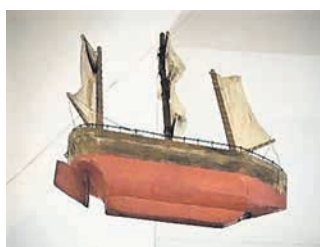
Votiivlaev, st merehädast pääsemise puhul kirikule kingitud laevamudel.

Vastukaalu sellele korralagedusele hakkasid otsima kaupmehed, kes röövide pärast enim kannatasid. „Die Hanse” nime alla hakkasid