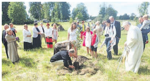
Leerilapsed istutavad koguduse õunaaeda õunapuud. MAIT MEISTER

Kirikuraamatut sirvides jäi silma, et ka 25 aastat tagasi liitus kogudusega kena hulk ristiinimesi.