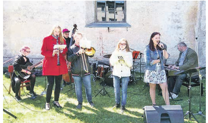
Pärast teenistust musitseeris Lihula muusika- ja kunstikooli džässbänd Junior Danceband. TUULI RAAMAT