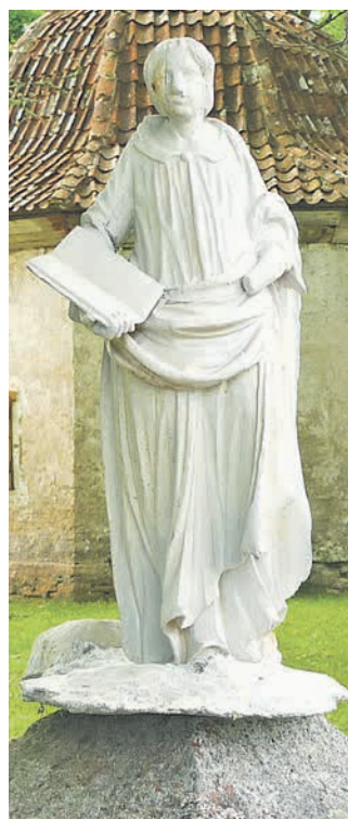
Karuse kiriku 19. sajandi altarile paigutatud Ackermanni skulptuur. HILKKA HIIOP

vaatluse alla ka Lihula kirikust kohale toodud kantsliskulptuurid. Nii Karuse 18. sajandi lõpul ehitatud varaklassitsistlikul altaril kui ka Lihula 19. sajandi II poolel loodud neogooti stiilis kantslil on barokkskulptuurid sekundaarsed – pärit Ackermanni valmistatud kantslitelt. Taaskasutus on ka varem moes olnud! Leiti palju huvitavat materjali. Parim pala oli teadaolevalt ainus originaalvärvides kujuke, nn puto ehk inglisepeake, mis oli peidetud pingirea taha ja nüüd on avatud.