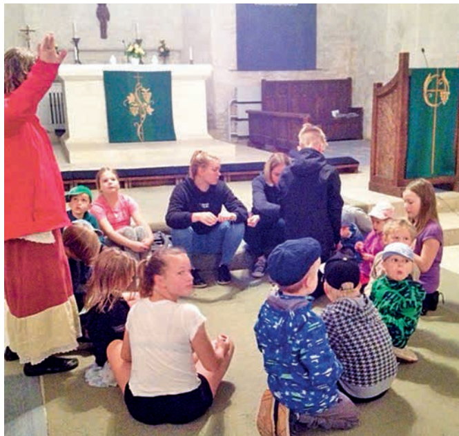
Lapsed kuulavad toomkirikuga seotud legende.

Kavas oli ka meeleolukas aardejaht, mängud suurtele ja väikestele ning õhtune filmivaatamine. Laa-